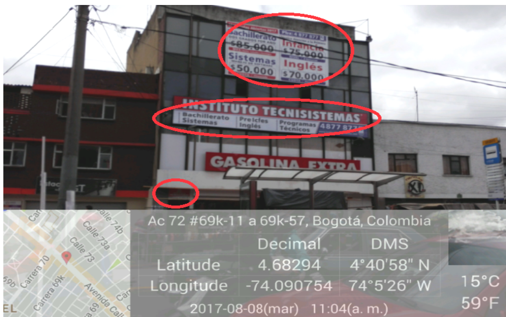
Fotografía No. 2. Fachada del predio donde se ubica el establecimiento de comercio objeto a estudio así mismo se puede observar que el establecimiento cuenta con más de un aviso por fachada, los cuales se encuentran ubicados en la parte superior de la edificación, entrada principal del primer piso y en la parte superior del segundo nivel el cual alcanza a cubrir las ventanas del tercer nivel.